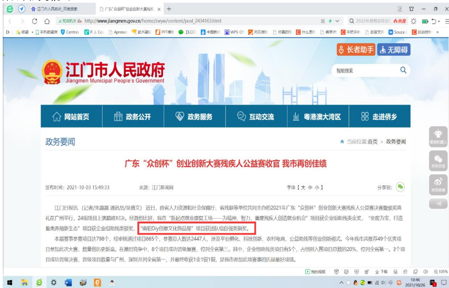
1. 江门市人民政府官网-“政务要闻”栏对项目获奖（众创杯）报道