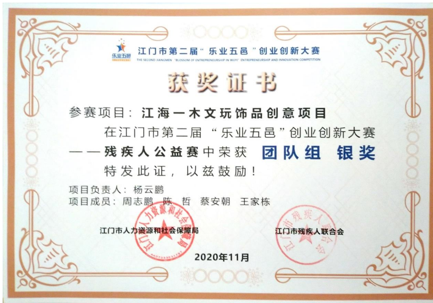
3. 2020年团队获江门市“乐业五邑”创业大赛银奖