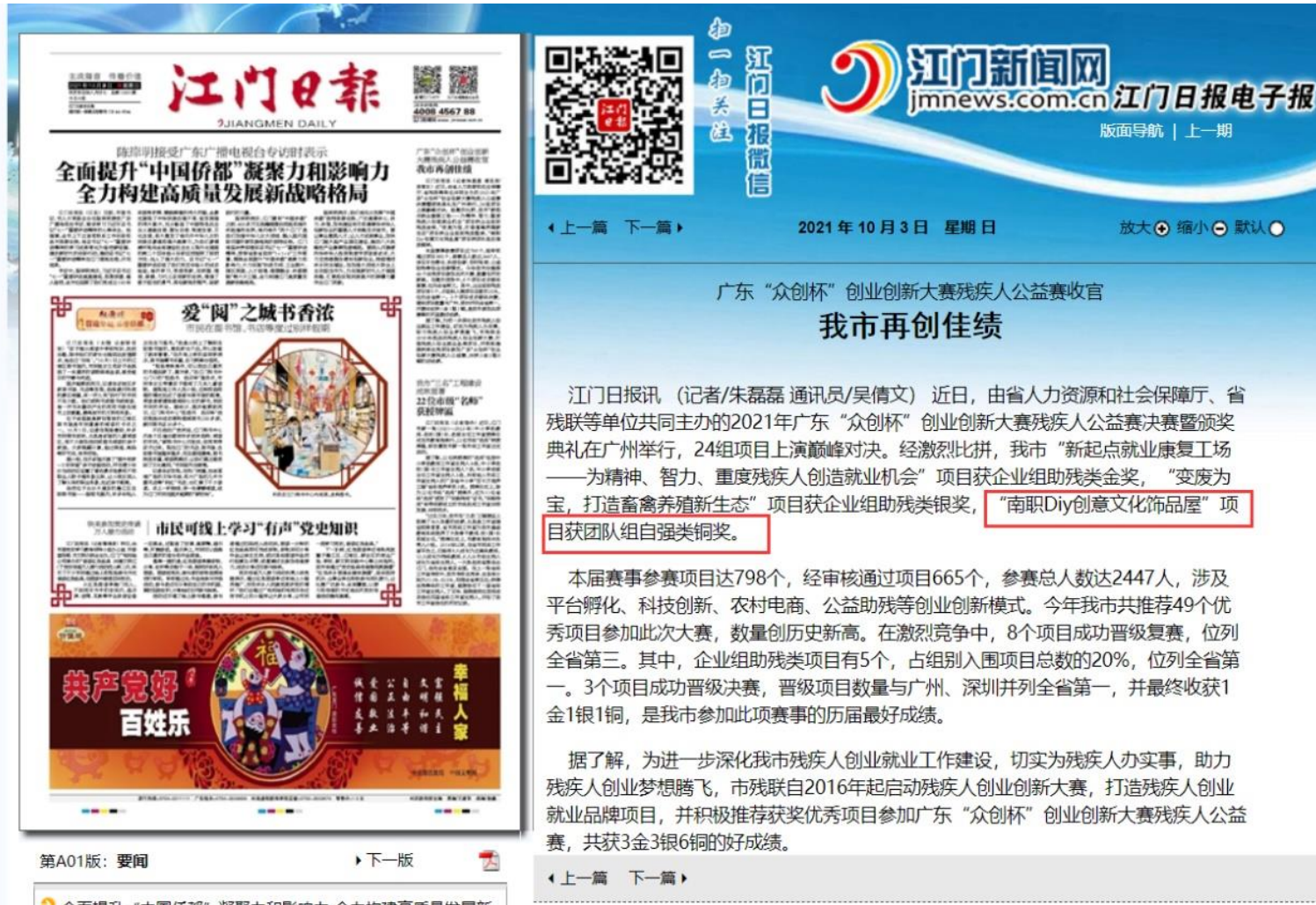
2. 《江门日报》2021.10.3 头版对项目获奖的报道